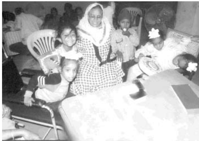
ਪਿੰਗਲਵਾੜਾ ਦੇ ਬੱਚਿਆਂ ਨਾਲ ਖੇਡਦੇ ਹੋਏ ।

ਵੱਲ ਜਾਣ ਲਈ ਵੱਖ-ਵੱਖ ਰਸਤੇ ਹੀ ਹਨ ਤੇ ਧਰਮ ਨੂੰ ਕਿਸੇ ਪਰਮਾਤਮਾ ਨੇ ਨਹੀਂ ਬਲਕਿ ਮਨੁੱਖਾਂ ਨੇ ਆਪ ਹੀ ਬਣਾਇਆ ਹੈ। ਭਾਵੇਂ ਸਾਰੇ ਧਰਮਾਂ ਦਾ ਉਦੇਸ਼ ਇਕ ਹੈ, ਪਰ ਰਸਤੇ ਅਲੱਗ-ਅਲੱਗ ਹਨ। ਇਹ ਰਸਤੇ ਭਾਸ਼ਾ, ਭੂਗੋਲਿਕ ਤੇ ਸਮਾਜਿਕ ਹਾਲਤਾਂ ਆਦਿ ਕਰਕੇ ਵੱਖਰੇ ਹਨ। ਉਸਨੇ ਮਹਿਸੂਸ ਕੀਤਾ ਕਿ ਇਸ ਸੰਮੇਲਨ 'ਚ ਭਾਗ ਲੈ ਕੇ ਉਸਨੇ ਕਾਫੀ ਕੁਝ ਸਿੱਖਿਆ ਹੈ। ਅਲੱਗ-ਅਲੱਗ ਧਰਮਾਂ ਬਾਰੇ ਜਾਣਕਾਰੀ ਸਿੱਖਣ ਤੋਂ ਇਲਾਵਾ, ਉਸਦੀ ਕਈ ਲੋਕਾਂ ਨਾਲ ਜਾਣਕਾਰੀ ਵੀ ਵਧੀ । ਉਸਨੂੰ ਇਸ ਸੰਮੇਲਨ 'ਚ, ਆਪਣੀਆਂ ਸੇਵਾਵਾਂ ਲਈ ਸਨਮਾਨਿਤ ਵੀ ਕੀਤਾ ਗਿਆ।