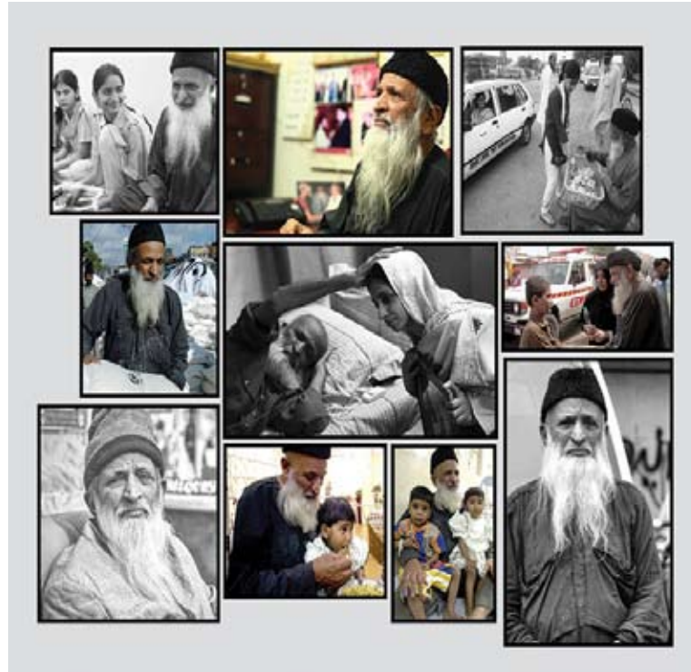
ਮਹਾਨ ਸਮਾਜ ਸੇਵਕ ਅਬਦੁਲ ਸੱਤਾਰ ਈਦੀ ਦੇ ਜੀਵਨ ਦੇ ਵੱਖ-ਵੱਖ ਪਹਿਲੂ ।

ਵਿੱਚ ਮੰਤਰੀ ਨਿਯੁਕਤ ਕੀਤਾ ਗਿਆ ਸੀ, ਪਰ ਉਹਨਾਂ ਨੇ ਉਸ ਤੋਂ ਇਕ ਮਹੀਨੇ ਬਾਅਦ ਹੀ ਅਸਤੀਫਾ ਦੇ ਦਿੱਤਾ ਸੀ। ਇਹ ਸਭ ਕੁਝ ਮੈਨੂੰ ਬਹੁਤ ਦਿਲਚਸਪ ਜਾਪਿਆ, ਪਰ ਮੇਰੇ ਮਨ 'ਚ ਇਕ ਡਰ ਪੈਦਾ ਹੋ ਗਿਆ ਕਿ ਏਨੇ ਰੁਝੇਵਿਆਂ ਭਰੇ ਆਦਮੀ ਦਾ ਮੈਨੂੰ ਮਿਲਣਾ ਸ਼ਾਇਦ ਸੰਭਵ ਨਾ ਹੋਵੇ।