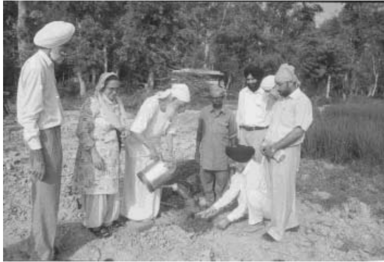
ਪਿੰਗਲਵਾੜਾ ਵਿੱਚ ਵਣ-ਮਹਾਉਤਸਵ ਮਨਾਉਂਦੇ ਹੋਏ ।